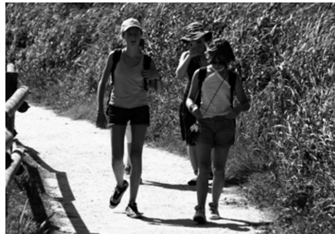
Le Junior Rangere delle Prealpi Giulie sui sentieri della Catalogna