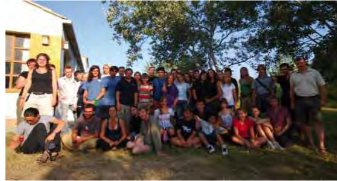
Il gruppo dei partecipanti al campo internazionale

Questo campo è stato un'esperienza fantastica, irripetibile; abbiamo conosciuto molta gente e ci siamo divertiti un sacco. È stata una settimana ricca di esperienze diverse; abbiamo faticato molto ma allo stesso tempo ci siamo divertiti parecchio. È stata inoltre una grande esperienza culturale: abbiamo visto dei piccoli paesi della Catalogna, abbiamo scoperto le loro tradizioni, ascoltato la loro musica, imparato i balli catalani e assaggiato la loro