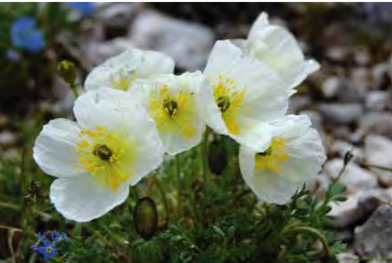
Il Papavero delle Giulie

Vi ricordiamo che le immagini ritenute più meritevoli saranno anche inserite nel sito del Parco www.parcoprealpigiulie.it , appena ristrutturato e che vi invitiamo a visitare.