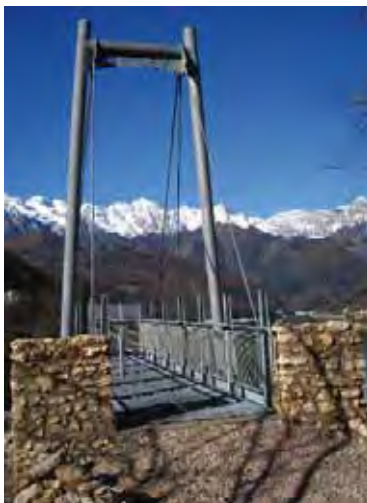
Sky Walk

La Riserva naturale della Forra del Cellina comprende il territorio della grande incisione valliva scavata dal torrente Cellina tra i paesi di Andreis, Barcis e Montereale Valcellina, in provincia di Pordenone ed è gestita dal Parco naturale delle Dolomiti Friulane.