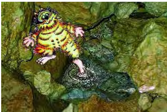
Guriuts (Dullio Cobol / disegno Susanna Martinuzzi)

Prima di lasciare la galleria superiore, gli speleosub hanno provveduto alla documentazione fotografica e alla raccolta di campioni d'acqua da far analizzare da persone competenti. Il maltempo e il disgelo