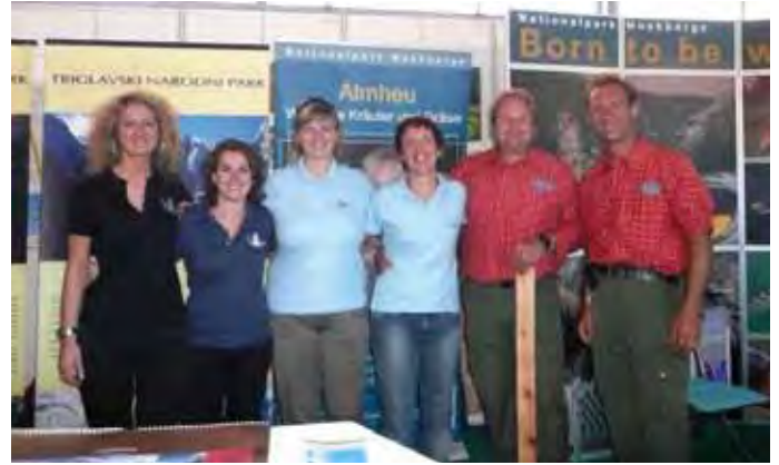
L'ERA team a Gornja Radgona

La cittadina di Gornja Radgona, comune della Slovenia nord-orientale di circa 12.000 abitanti al confine con l'Austria e a circa 30 km dal confine ungherese, ospita ogni anno un'importante fiera dell'agricoltura e dei prodotti agroalimentari; questa rappresenta un evento di settore di rilevanza nazionale ed internazionale e vede la partecipazione di migliaia di visitatori pro-