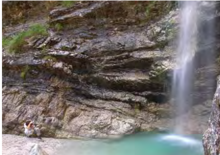
A caccia di immagini nel Parco - agosto 2009

In questi dieci anni si è fatto molto; il Parco oggi rappresenta, per noi che lo percorriamo a piedi con piccole e grandi comitive al seguito, una delle realtà montane meglio attrezzate per quanto riguarda sentieristica, didattica e punti d'appoggio. In questo arco di tempo la proposta si è inoltre molto arricchita e diversificata. Quello che era inizialmente un semplice calendario di escursioni monotematiche, è diventato un ventaglio di possibilità di fruizione del territorio sotto innumerevo-