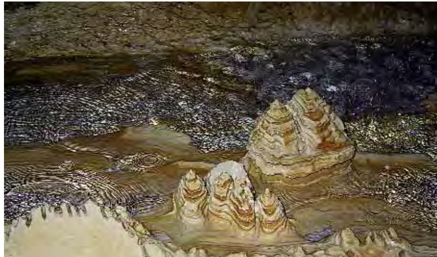
Le piramidi del villaggio Guriut...

anticipato non hanno permesso di organizzare ulteriori esplorazioni, così si è provveduto a smontare e a sistemare, in luoghi ritenuti relativamente sicuri, il campo base avanzato e parte del materiale per la progressione speleologica.