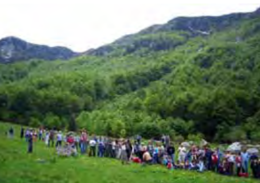
Gli eventi portano turismo nel Parco ...

La Convenzione delle Alpi è un trattato internazionale sottoscritto dall'Unione Europea e da otto Paesi Alpini - Germania, Francia, Italia, Liechtenstein, Principato di Monaco, Austria, Svizzera e Slovenia - con le finalità della protezione dell'ecosistema dello spazio alpino e per una sua gestione sostenibile.