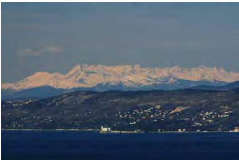
Il Canin da Trieste

Continuate allora a inviarci le vostre foto.