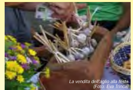
La vendita dell'aglio alla festa

L'escursione guidata "Giochi d'acqua" ha consentito ai più volenterosi di conoscere ed apprezzare le caratteristiche e l'impor-