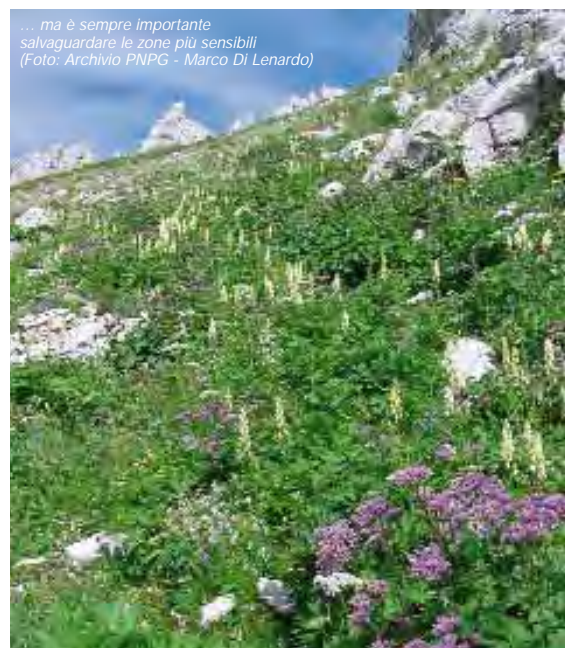
... ma è sempre importante salvaguardare le zone più sensibili