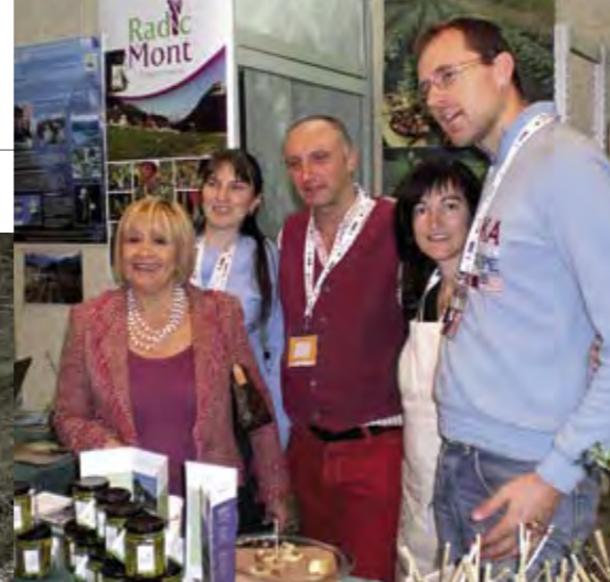
I rappresentanti dell'Aglio di Resia e del Radic di Mont con Anna Moroni de "La prova del cuoco"