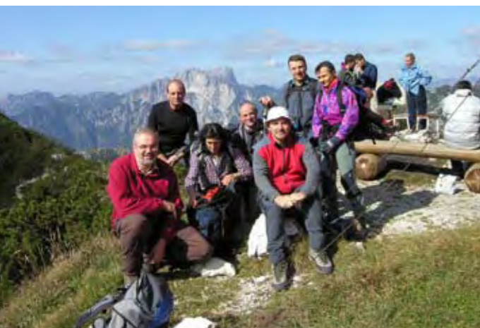
In escursione al Bivacco Bianchi

L'appuntamento settembrino con la Val Alba sembra ormai consolidato. Giunta alla sua terza edizione, la manifestazione non ha deluso le aspettative di quanti si sono trovati, in modo semplice e cordiale, a ricrearsi nei paesaggi offerti dalla conca del Vuált. Quest'anno, a causa del maltempo, gli Organizzatori sono stati costretti a posticipare al giorno 28 l'appuntamento previsto per domenica 14 settembre. Questo "slittamento" sembra non aver influito sensibilmente sulla partecipazione che è rimasta comunque numerosa.