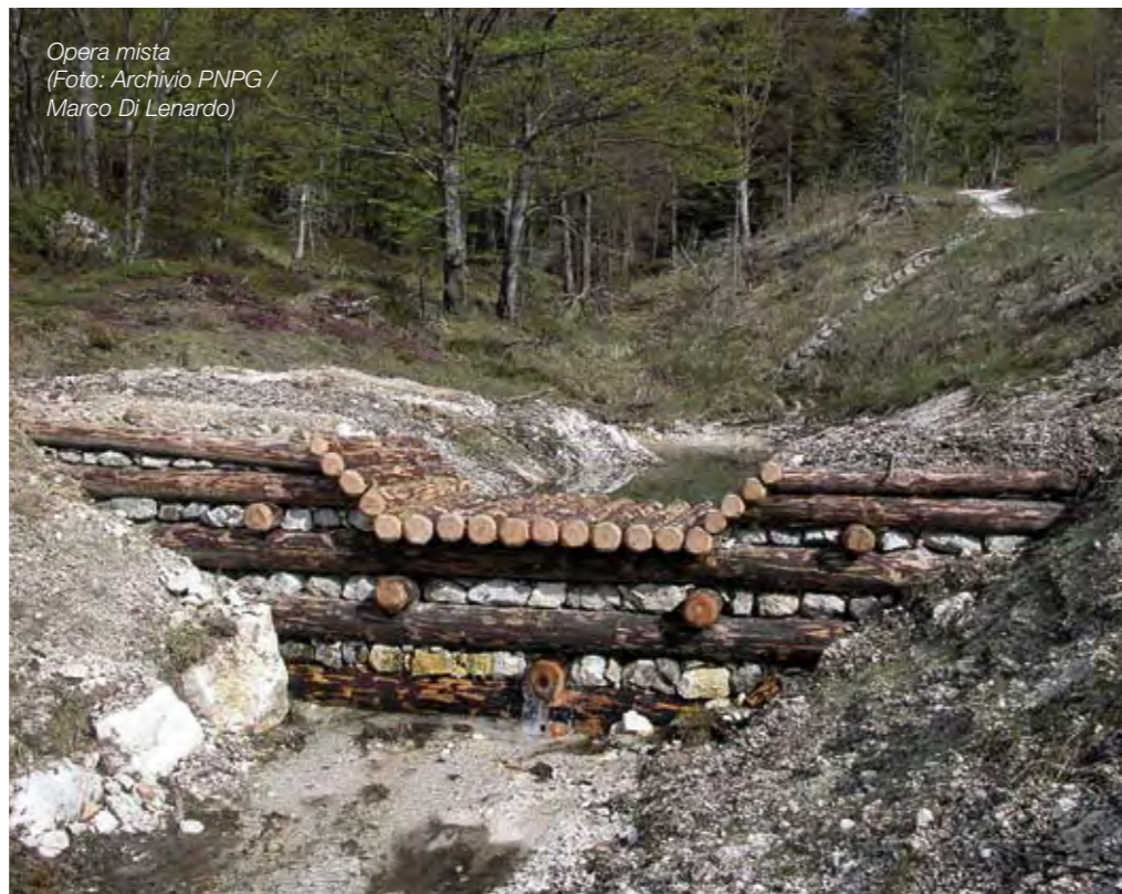
Opera mista

di ingegneria naturalistica (art. 14) evitando gli effetti negativi causati dalle attività turistiche sul suolo; • Riduzione preventiva degli apporti di inquinanti nei suoli tramite l'aria, l'acqua, i rifiuti ed altre sostanze nocive per l'ambiente.