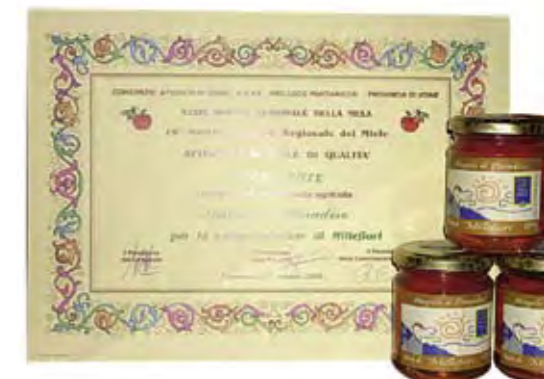
Il miele e il riconoscimento