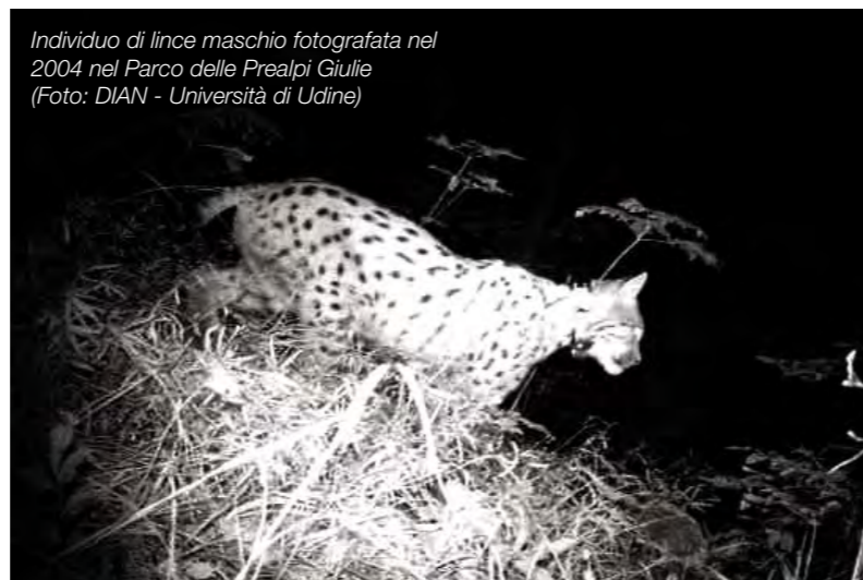
Individuo di lince maschio fotografata nel 2004 nel Parco delle Prealpi Giulie