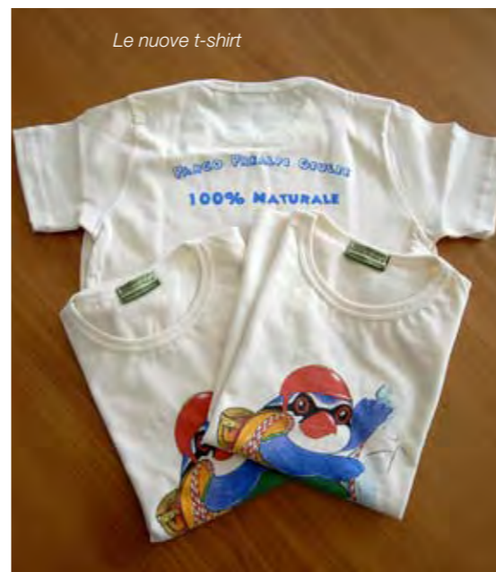
Le nuove t-shirt