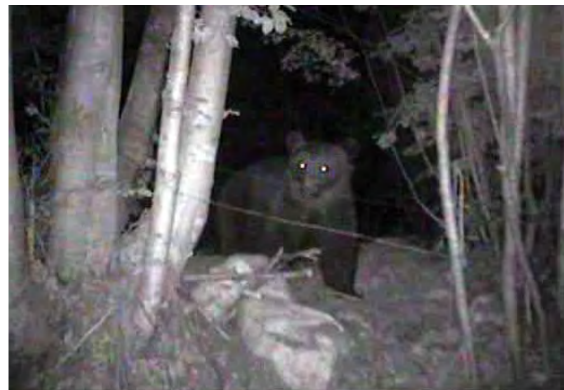
Orso presso un'esca per la raccolta del pelo in prossimità dei confini del Parco delle Prealpi Giulie

Il 2008 è stato caratterizzato da un elevato numero di avvistamenti di questa specie in ogni parte della regione: nelle aree limitrofe al Parco, in cui maggiore è la presenza antropica, nella zona collinare di Tarcento, lungo la cresta e le pendici del Gran Monte ed in vicinanza del fondovalle presso Nimis. Questo fenomeno potrebbe essere dovuto alle particolari condizioni alimentari di quest'anno, che probabilmente hanno spinto alcuni individui ad utilizzare maggiormente i punti di foraggiamento dei cacciatori e le colture fruttifere nelle media collina, o all'arrivo di nuovi individui.