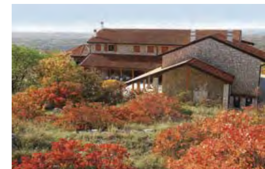
Centro visite "Gradina"

La Cooperativa Rogos gestisce il centro visite, organizza, previa prenotazione, laboratori didattici, attività di play climbing con guide alpine regionali e visite guidate della Riserva durante tutto l'anno, avvalendosi di accompagnatori esperti. Info: Soc. Coop. Rogos via Vallone, 32 - 34070 Doberdò del Lago/Doberdob www.parks.it, www.gradina.it, cell.: +39 333 4056800 tel./fax.: +39 0481784111