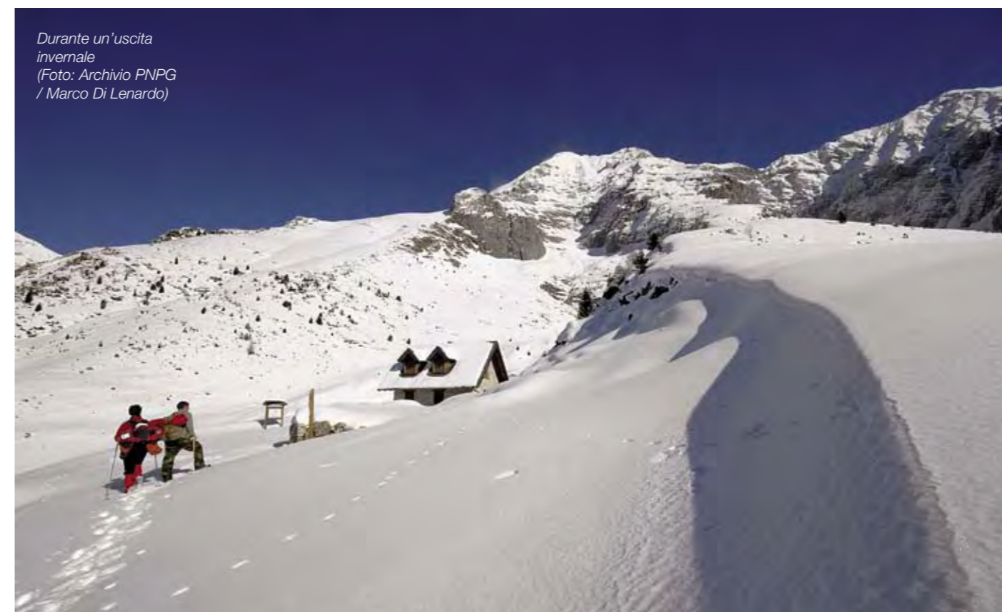
Durante un'uscita invernale