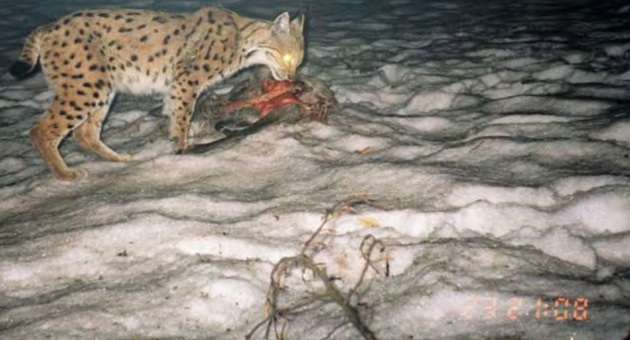
Lince radiocollata intenta a consumare una preda