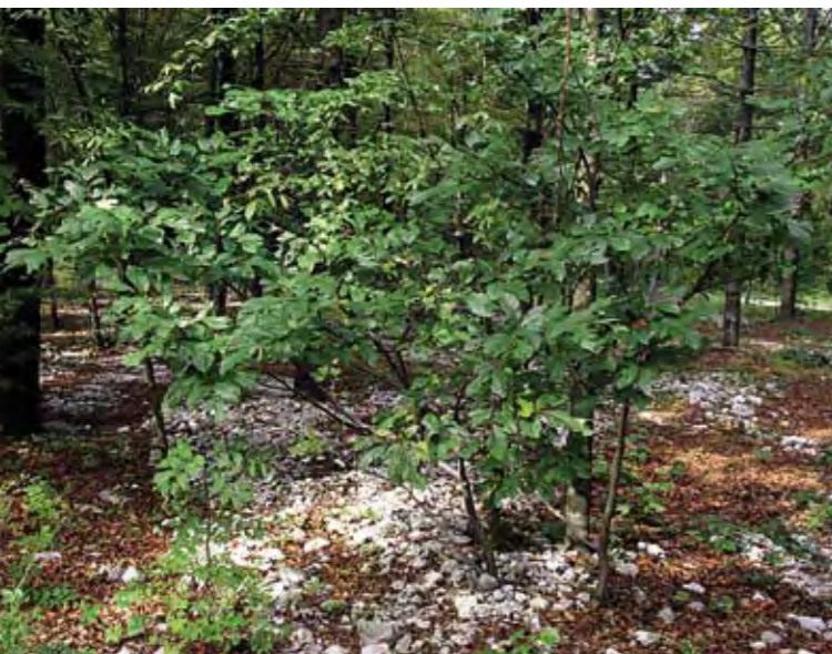
Rhamnus alpina L. subsp. fallax (Boiss.) Maire & Petitm