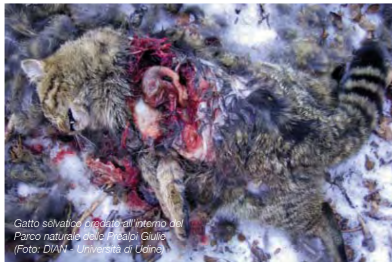
Gatto selvatico predato all'interno del Parco naturale delle Prealpi Giulie

(*) Ricercatore Dipartimento di Scienze Animali Università di Udine