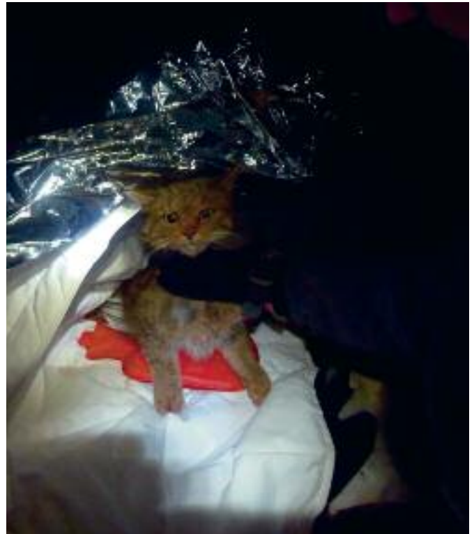
Il gatto viene adagiato all'interno di una coperta termica con una fonte di calore per proteggerlo nella fase di post narcosi