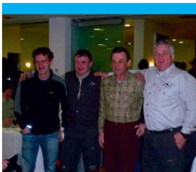
Il team transfrontaliero Triglav & Prealpi Giulie

L'appuntamento per il prossimo anno è al Parco dell'Adamello, con l'auspicio che il Parco possa partecipare anche a questa edizione