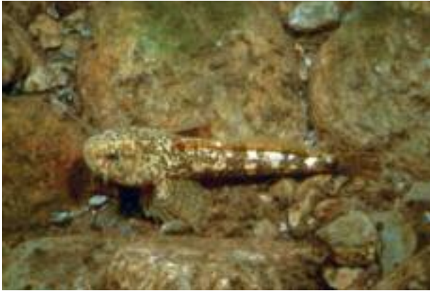
Lo scazzone ( Cottus gobio )