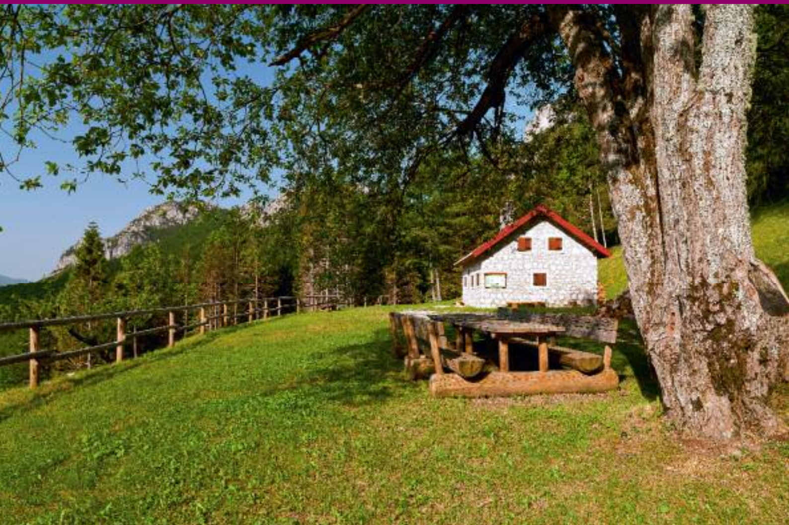
Il ricovero montano Casera Vuâl

a tutti nei mesi di gennaio e luglio del 2010 da cui sono emerse alcune tematiche di rilievo, quali ad esempio: la manutenzione e la salvaguardia dei sentieri e dei manufatti storici e la richiesta da parte dei cittadini di Moggio di poter utilizzare parte della risorsa legno nella proprietà regionale. Il gruppo di lavoro ha inoltre incontrato l'amministrazione comunale più volte nel corso del 2010 e nel 2011 oltre che la SNAM e gli uffici regionali per discutere ed approfondire alcuni elementi del piano. Il 7 aprile scorso è stata infine presentata la bozza del piano di gestione alla popolazione per racco-