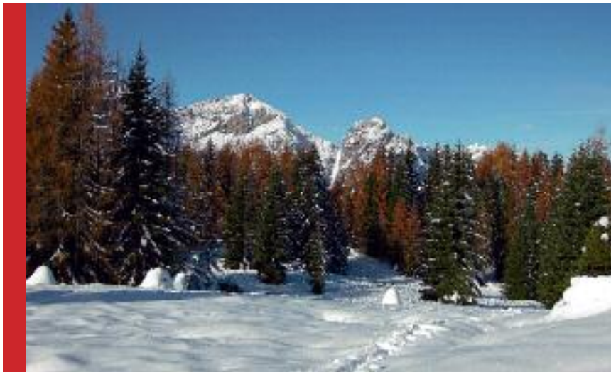
Cima Cucco verso lo Scinauz