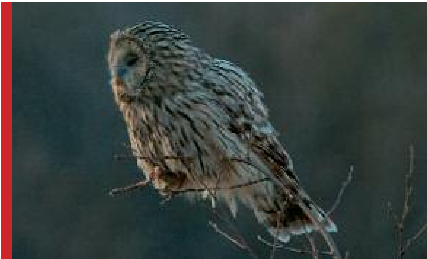
L'Allocco degli Urali ...

Il Parco delle Prealpi Giulie rappresenta, com'è noto, un'area di enorme valore dal punto di vista biogeografico e naturalistico. Studi e ricerche compiute negli ultimi anni hanno consentito di evidenziare una varietà faunistica sorprendente, con la scoperta continua di nuove specie che rappresentano spesso endemismi di grande valore, presenti quindi solamente in quest'area o in poche altre zone, o addirittura specie completamente nuove per la scienza. Queste scoperte riguardano solitamente invertebrati, che a causa della notevole varietà e difficoltà di riconoscimento rappresentano un gruppo ancora poco conosciuto. Ma le sorprese arrivano questa volta da altri "ospiti", ben più grandi, che sono passati inosservati pur convivendo con l'uomo da tempi immemorabili nelle nostre valli. Veri fantasmi dei boschi, elusivi e notturni, che non lasciano alcuna traccia e la cui presenza può essere colta solo grazie ad indizi individuabili attraverso metodologie adeguate e una lunga esperienza sul territorio.