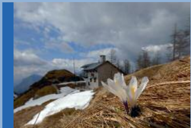
Primavera a Sella Buia

Tutte le informazioni sul sito del Parco: www.parcoprealpigulie.it .