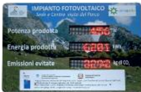
Il display dell'impianto fotovoltaico presso il Centro visite di Resia

Il Parco nell'ambito del progetto Climaparks ha già provveduto al completamento di alcune azioni pilota. È stato infatti installato l'impianto fotovoltaico da 20 kW sul tetto della sede dell'Ente a Prato di Resia. E' attesa una produzione annua di circa 20000 KWh in grado di rendere quasi autosufficiente lo stabile dal punto di vista del consumo di energia elettrica. Questo consentirà un abbattimento di 13.820 Kg di CO2 non immessa in atmosfera ed un risparmio di 3,74 tonnellate di petrolio equivalenti. Presso il centro visite è visibile il display che fornisce ai visitatori i dati in tempo reale sul risparmio energetico realizzato e sulla riduzione del consumo di CO2. È stata anche siglata la convenzione per il potenziamento del trasporto pubblico esti-