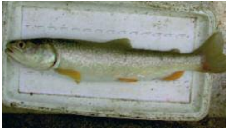
Trota marmorata del Resia

della morfologia dei corsi d'acqua sono il secondo elemento da tenere sotto stretta osservazione.