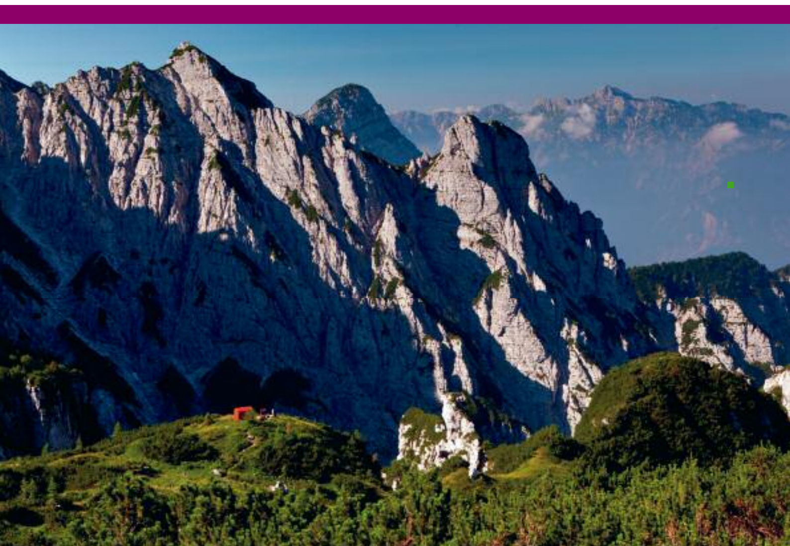
Il bivacco Bianchi nel cuore del SIC del Çuc dal Bôr

Nel piano viene sottolineata in modo esplicito la speranza che questo SIC, di proprietà regionale e parte di una riserva Naturale, possa diventare nel prossimo futuro un luogo privilegiato dove sperimentare in termini concreti la realizzazione di azioni a favore della conservazione della biodiversità, in modo tale che le buone pratiche e le esperienze che qui si potranno attuare, siano di esempio per altre aree della rete Natura 2000 della Regione. ■